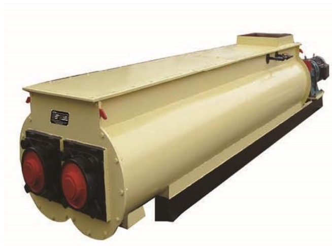
MEZCLADOR DE CICLO CONTÍNUO CON HUMIDIFICADOR

La utilización de aditivos como el almidón de maíz para facilitar la compactación puede ser recomendable ya que prolonga la vida útil de rodillos, matrices y otras partes móviles y aumentan considerablemente los rendimientos sin contaminar el pellet resultante, siempre y cuando no excedamos de entre un 2% y un 5% en la mezcla.