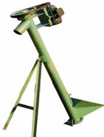
Tornillo de alimentación

También es recomendable la instalación de un sistema de alimentación tipo sinfín o cinta con motorreductor, con la finalidad de poder regular la dosis de material que le caiga a los rodillos.